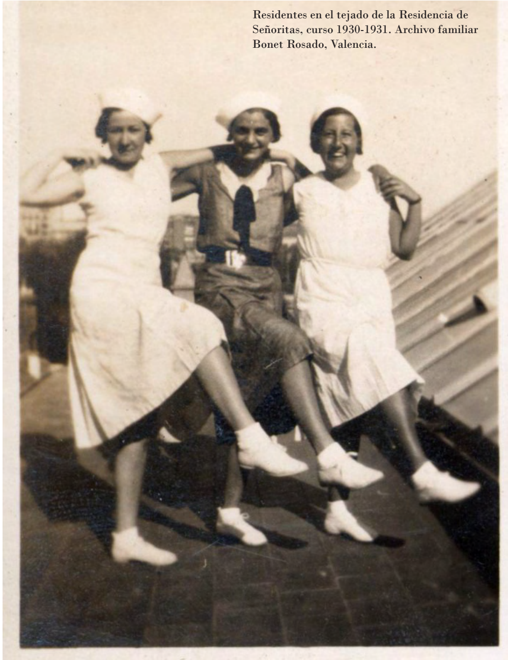
Residentes en el tejado de la Residencia de Señoritas, curso 1930-1931.