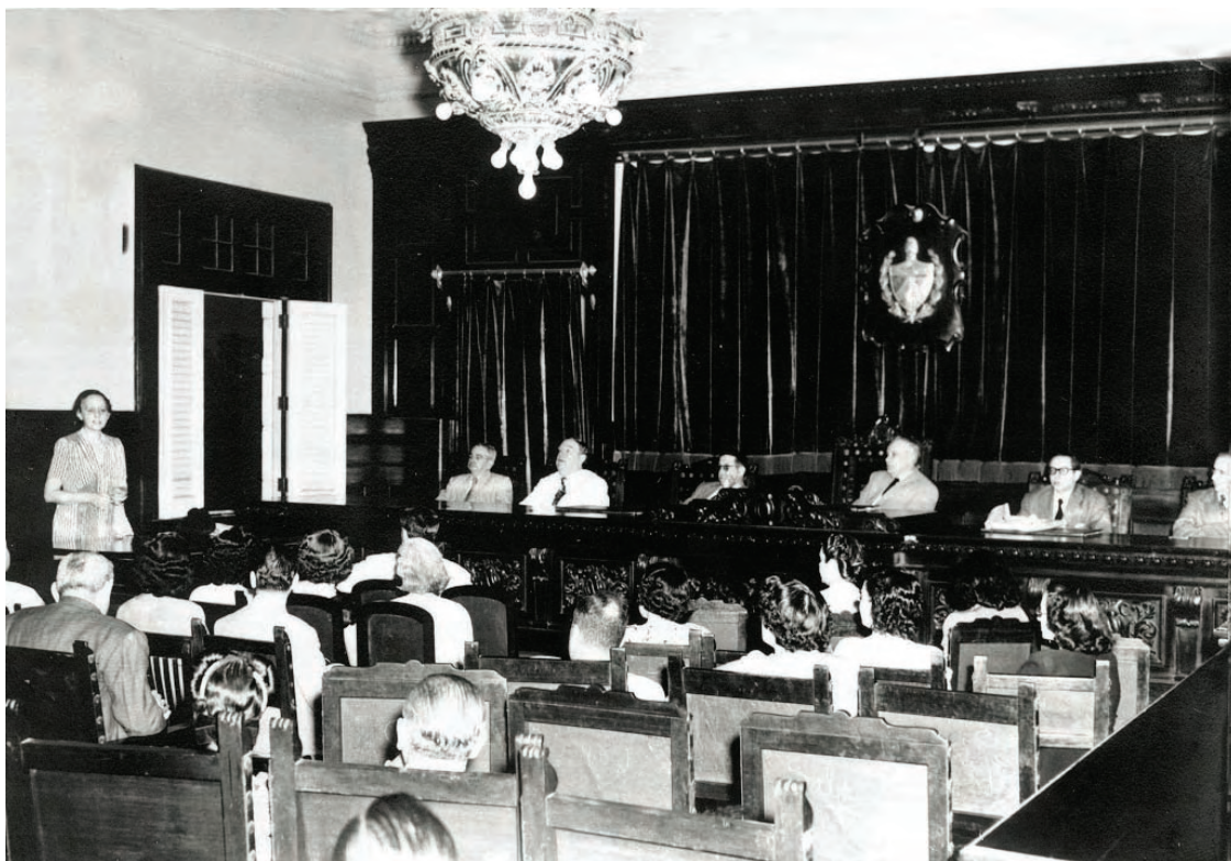
María Zambrano impartiendo una conferencia en el Paraninfo de la Universidad de Río Piedras, Puerto Rico, 1942. Copia de época. Fundación María Zambrano.