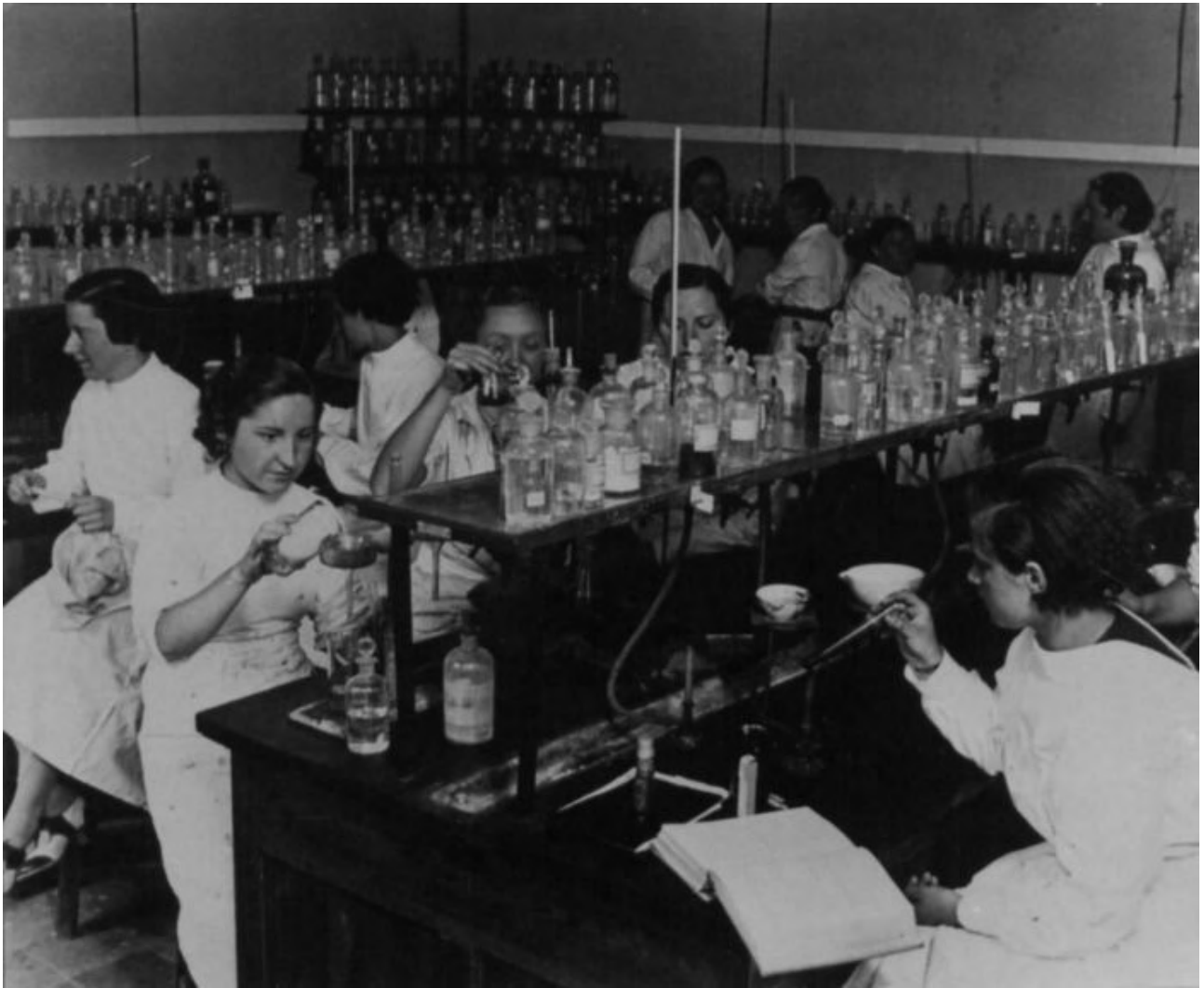
El Laboratorio Foster de la Residencia de Señoritas, hacia 1930.