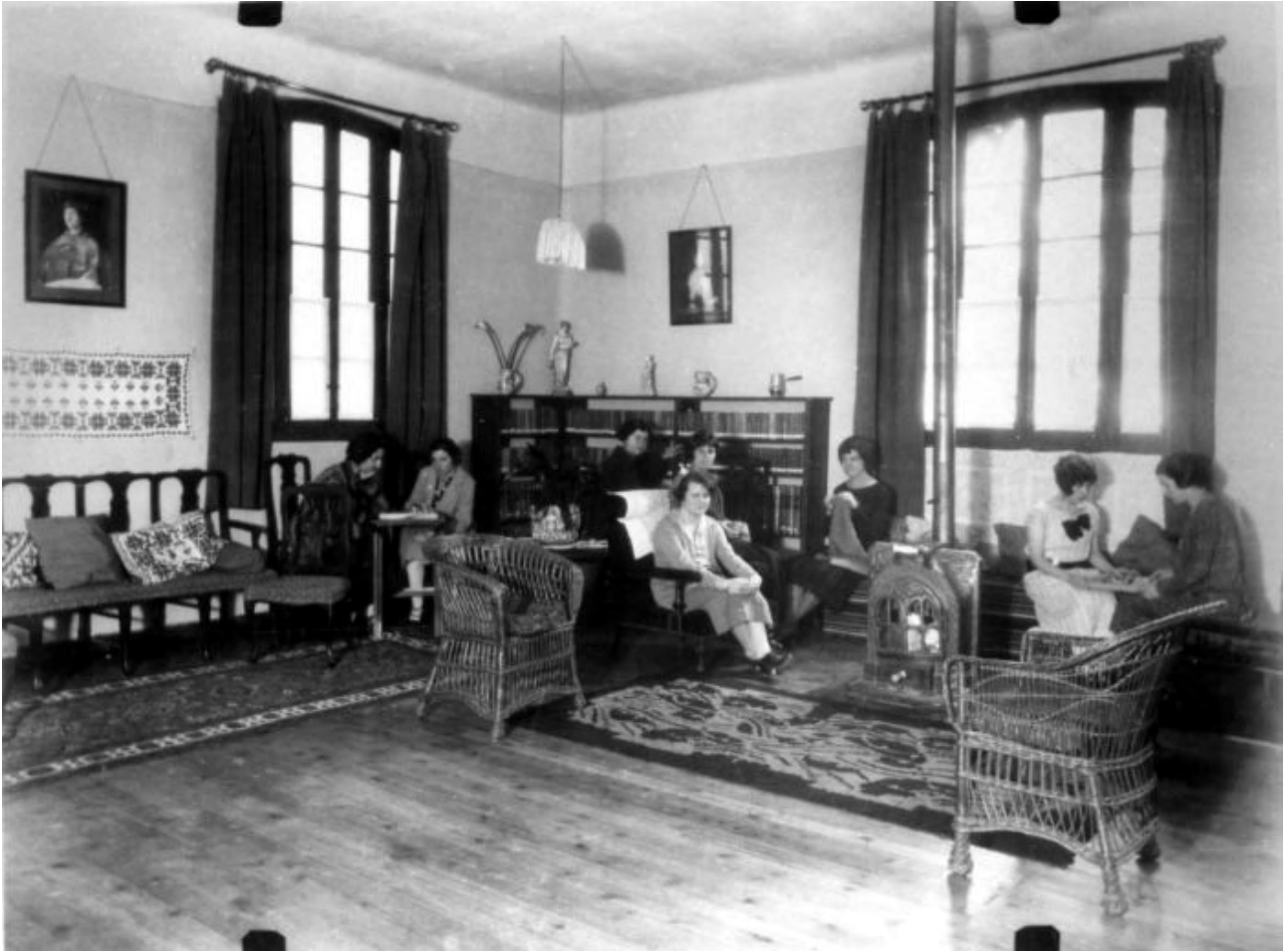
El salón de la Residencia de Señoritas en su sede de la calle de Fortuny, 30, Madrid, hacia 1923.