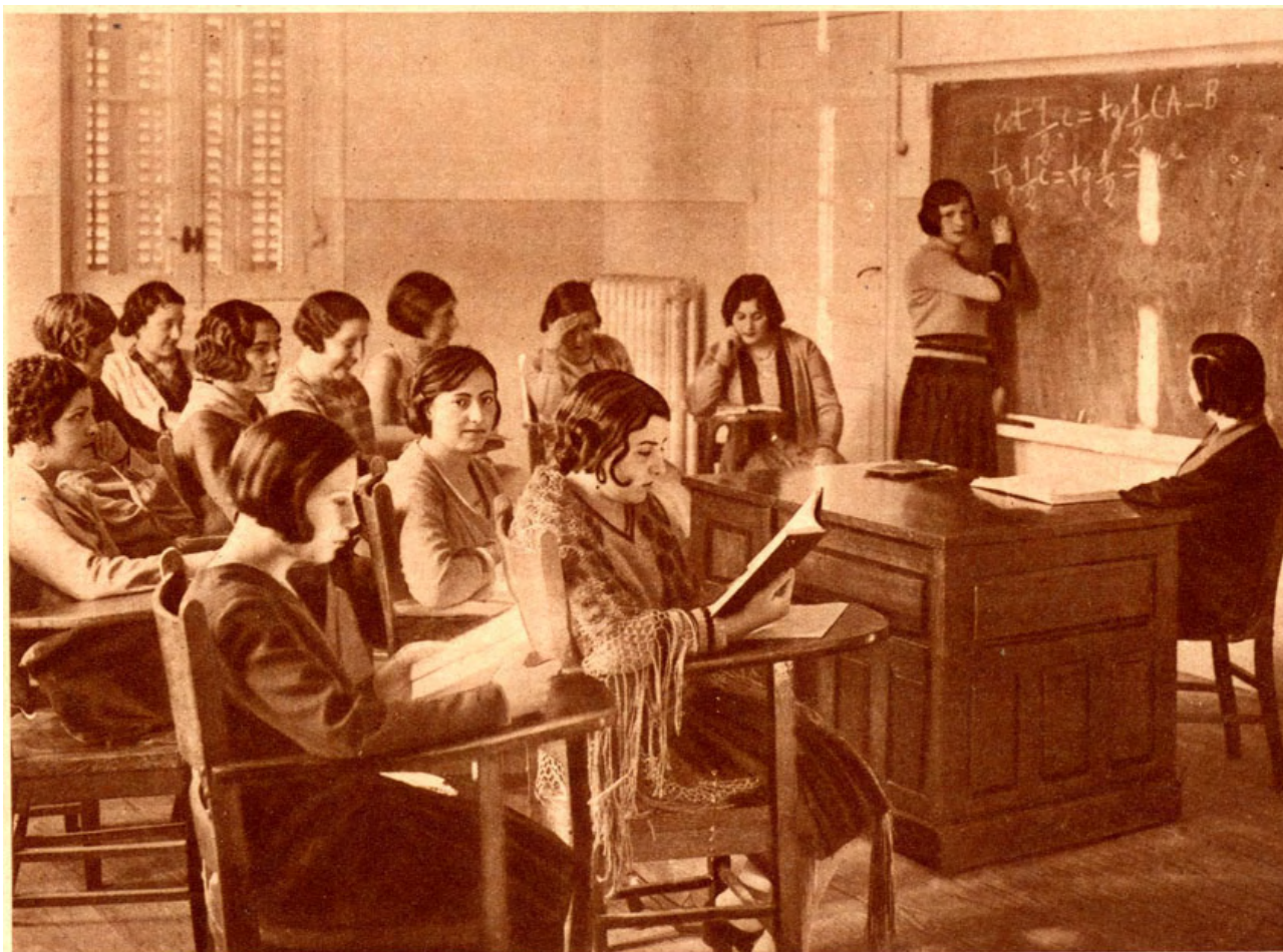
Una clase de Matemáticas en la Residencia de Señoritas. Fotografía publicada en la revista Crónica , 2 de marzo de 1930.